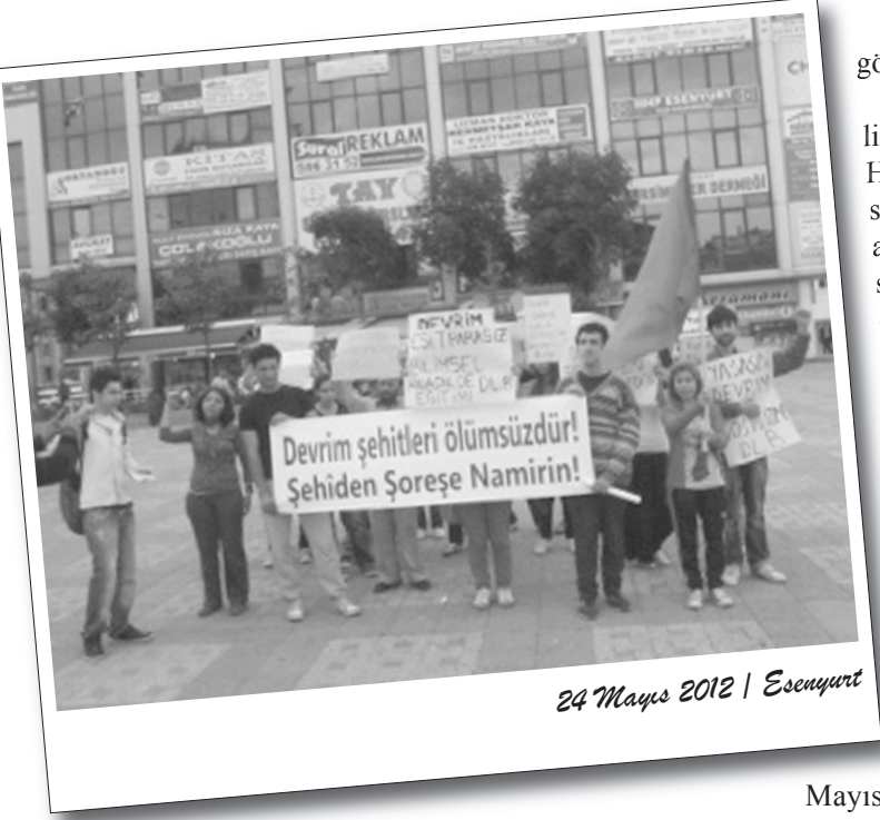
24 Mayıs 2012 | Esenyurt

Esenyurt DLB, Mayıs ayında sermaye devleti tarafından katledilen devrimci önderleri anmak için 24 Mayıs Perşembe günü etkinlik ve basın açıklaması gerçekleştirdi.